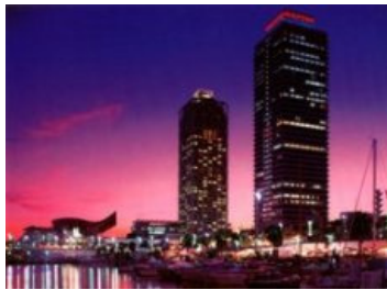
Barcelona vom Meer

Detaillierte Informationen zu den Casas Rurales und Hotels erhalten Sie im jeweiligen Kapitel. In den Übernachtungsstätten bekommen Sie selbstverständlich auch ein Frühstück.