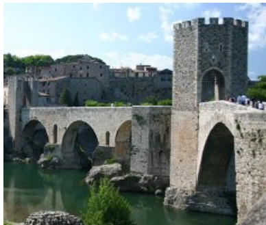
Es wartet das traumhafte Besalú...

Freuen Sie sich auf eine besondere Rundreise, die nur eines voraussetzt: Neugier auf die Vielfalt Kataloniens und seinen aufgeschlossenen Bewohnern.