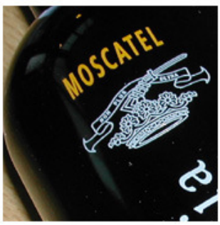
...und viele Spezialitäten